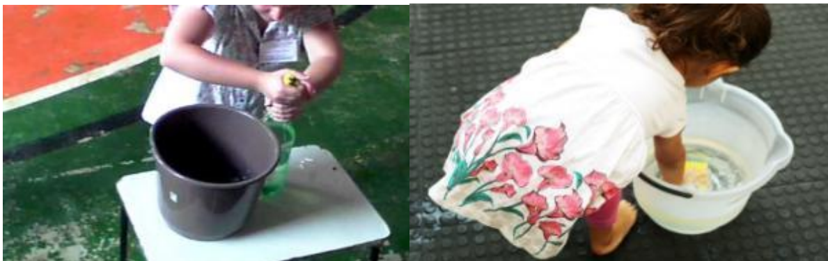
Imagens da atividade.

Para realizar a atividade encha o balde de água e ofereça a esponja para a criança molhar na água que está no balde e espremer dentro da garrafa pet até encher a mesma. Pode colocar a garrafa dentro de uma bacia para a criança não se molhar ou realize no espaço externo. Boa atividade.